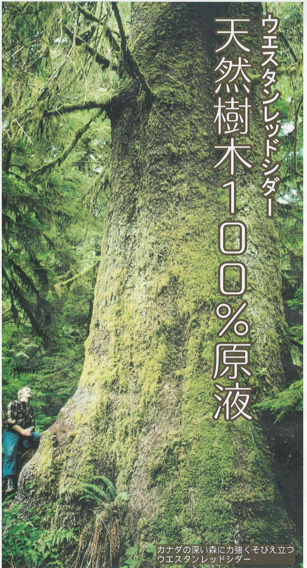
カナダの深い森に力強くそびえ立つ ウエスタンレッドシダー

ホワイトリリーの独自成分であるウエスタンレッドシダー水は、殺菌作用に大変優れ、お肌を健やかに保つ天然の成分が多く含まれています。乾燥によるかゆみや、カサカサのお肌など、お悩みにあわせて幅広くお使いいただけます。